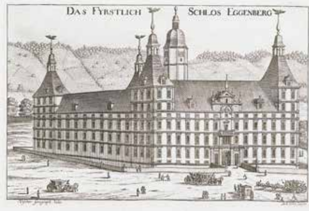
Eggenberg Kalesi'nin eski bakır gravürü.