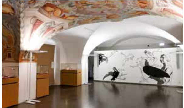
Okumalar ve sergiler için etkinlik salonu.

Özellikle çok değerli kitaplar kendi kitap ciltleme bölümümüzde restore edilir.