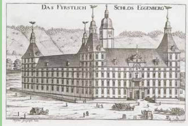
نقش قديم على النحاس من قصر إغينبرج.