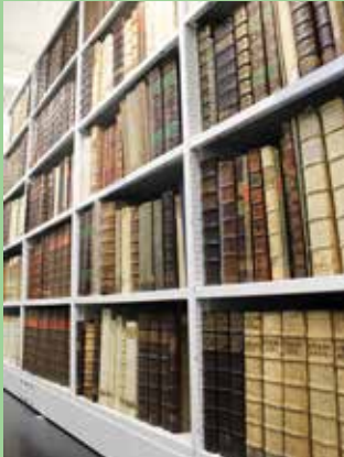
© جميع الحقوق محفوظة للمكتبة وولاية شتايرمارك (2)

نُظِّمَتِ المِجَلَّةُ بِمِسانَعَةِ الرَّفُوفِ المِتَحَرِّكَةِ وَتَضُمُّ حِوَالِي 700000 وَسِيط.