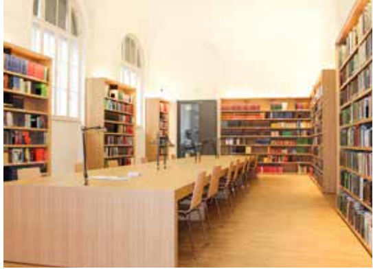
صالة القراءة في مكتبة ولاية شتايرمارك.

كجزء من عملية التجديد جُهزت صالة القراءة بأثاث جديد وبنية تحتية جديدة وتتميز بأنها مضيئة ومكيفة واسعة ومزودة بخدمة إنترنت لاسلكية مجانية. واستكمالاً لمجموعة الخدمات التي تقدمها المكتبة توجد خمسة "صناديق لرسائل الدكتوراه" قابلة للغلق تتوفر للطلاب مجاناً لمدة ثلاثة أشهر.