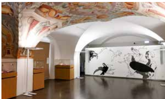
Dvorana za čitanje i izložbe.

Osobito vrijedne knjige se restauriraju u internoj knjigoveznici.