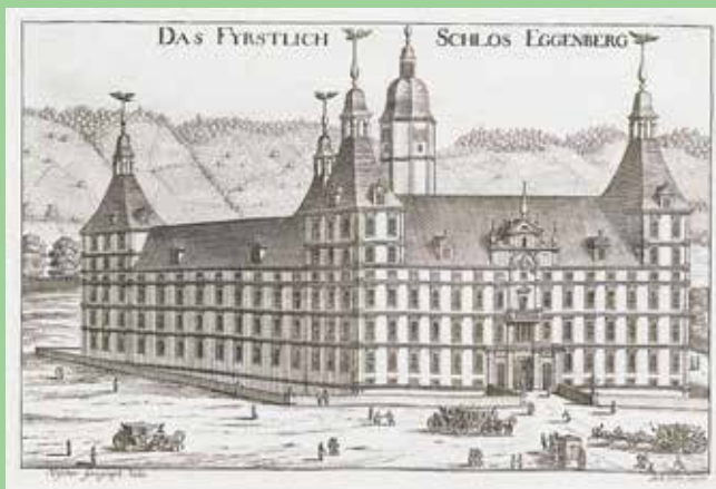
Stari bakrorez iz dvorca Eggenberg.